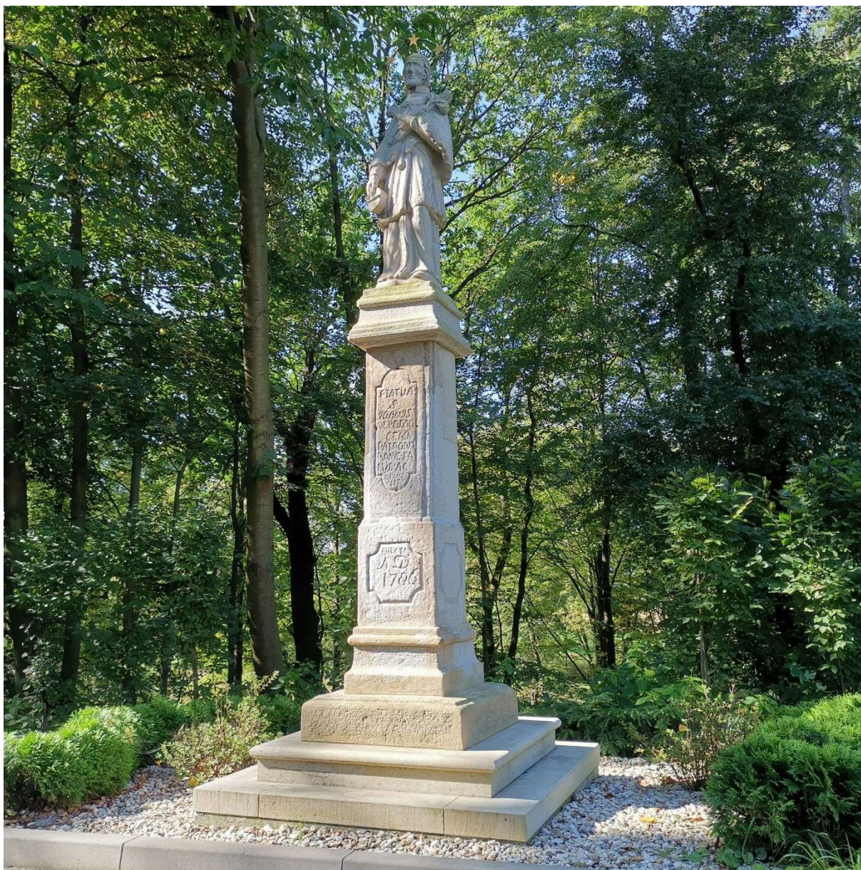
Figura św. Jana Nepomucena, na ul. Kościelnej w Bestwinie po renowacji.