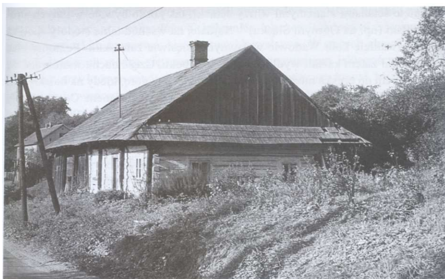
Ilustracja 3: Stara chata z ul. Kościelnej – nieistniejąca

Męki. W czasach nowożytnych, przed uwłaszczeniem chłopów i parcelacją dużych, pełnorolnych gospodarstw chłopskich, miejscowości posiadały charakter ulicówek o wyodrębnionych częściach (przysiółkach), których nazwy przetrwały w nazewnictwie lokalnym do czasów obecnych. Wioski stanowiące własność rycerską (alodialną) od XV w. ulegały bardzo często podziałom. Struktura przestrzenna poszczególnych jednostek osadniczych, istniejących na terenie obecnej gminy Bestwina – w tym średniowiecznych wsi – przetrwała aż do XIX w. Charakteryzuje się ona skupioną, zwartą zabudową, brakiem licznych rozproszonych przysiółków. Mimo rozrostu osad relikty pierwotnych układów przestrzennych są czytelne na kolejnych mapach wykonanych przed uwłaszczeniem chłopów, a następnie rozdrobnieniem gospodarstw, wskutek ich parcelacji między dzieci, głównie synów chłopów. Analiza przekazów kartograficznych z XIX w. pozwala na stwierdzenie, że ramy przestrzenne zabudowy nie wyszły poza ustalone przed wiekami obszary.