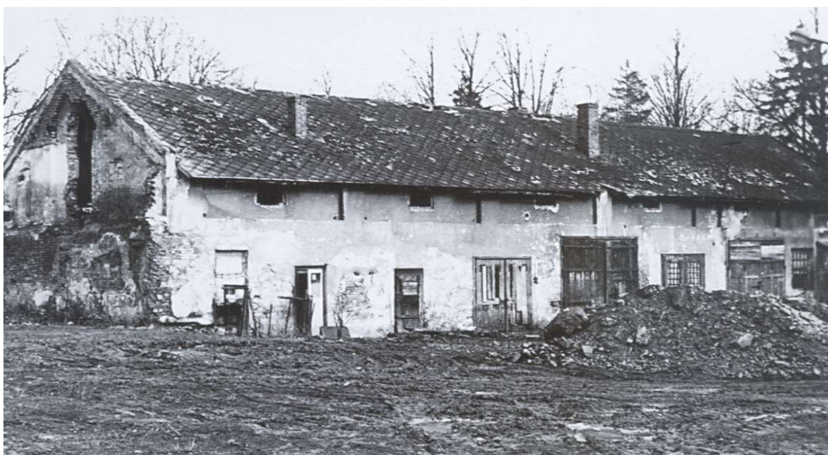
Ilustracja 2: Ruiny zabudowań gospodarczych w posiadłościach Habsburga - źródło: ks. Zygmunt Bubak "Bestwina". Obecnie teren poczty i okolice Domu Sportowca.