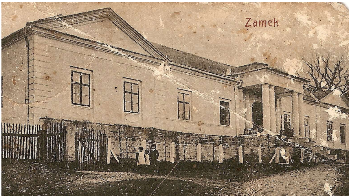
Ilustracja 1: Zdjęcie archiwalne - Pałac Habsburgów w Bestwinie