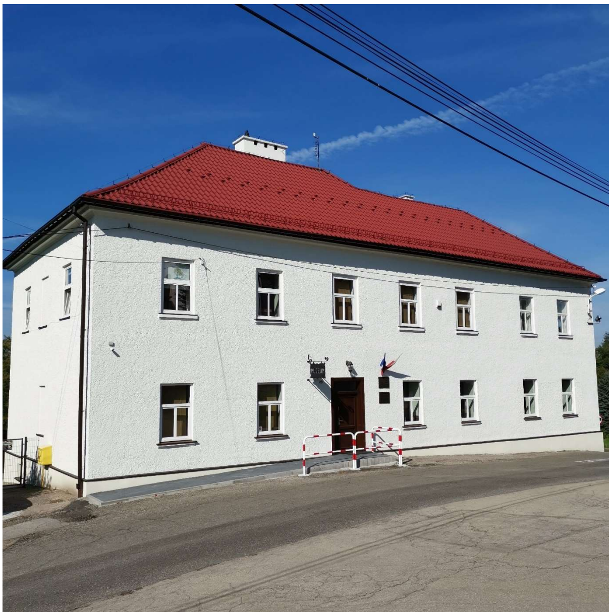
Budynek Muzeum Regionalnego im. Ks.Z.Bubaka w Bestwinie po renowacji elewacji.