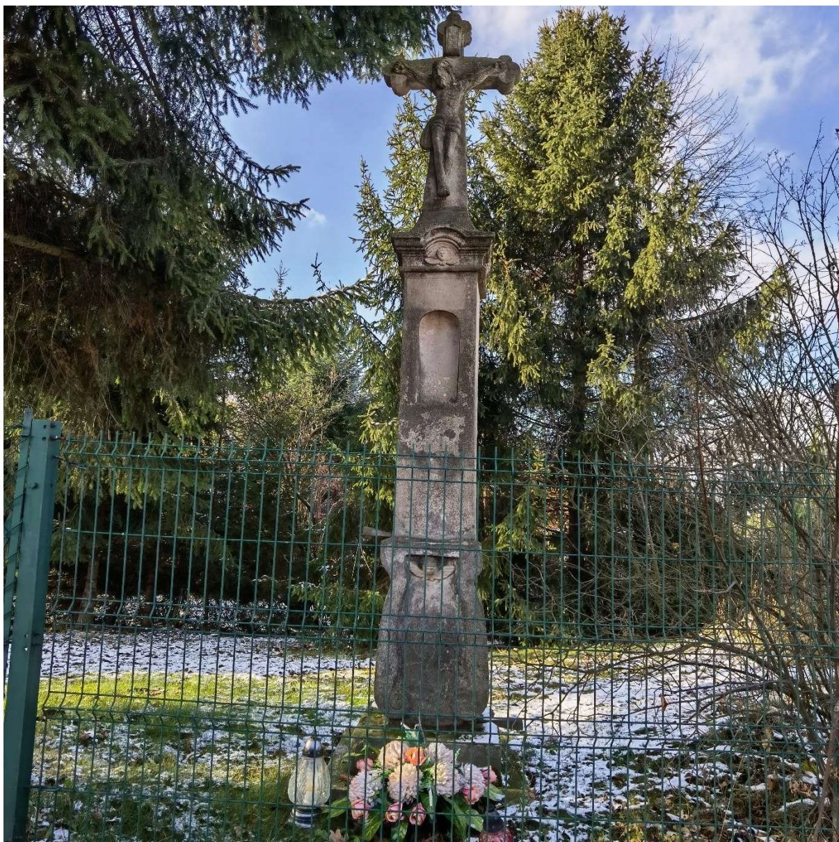
Krzyż Męki Pańskiej w Kaniowie przy ul. Malinowej 10