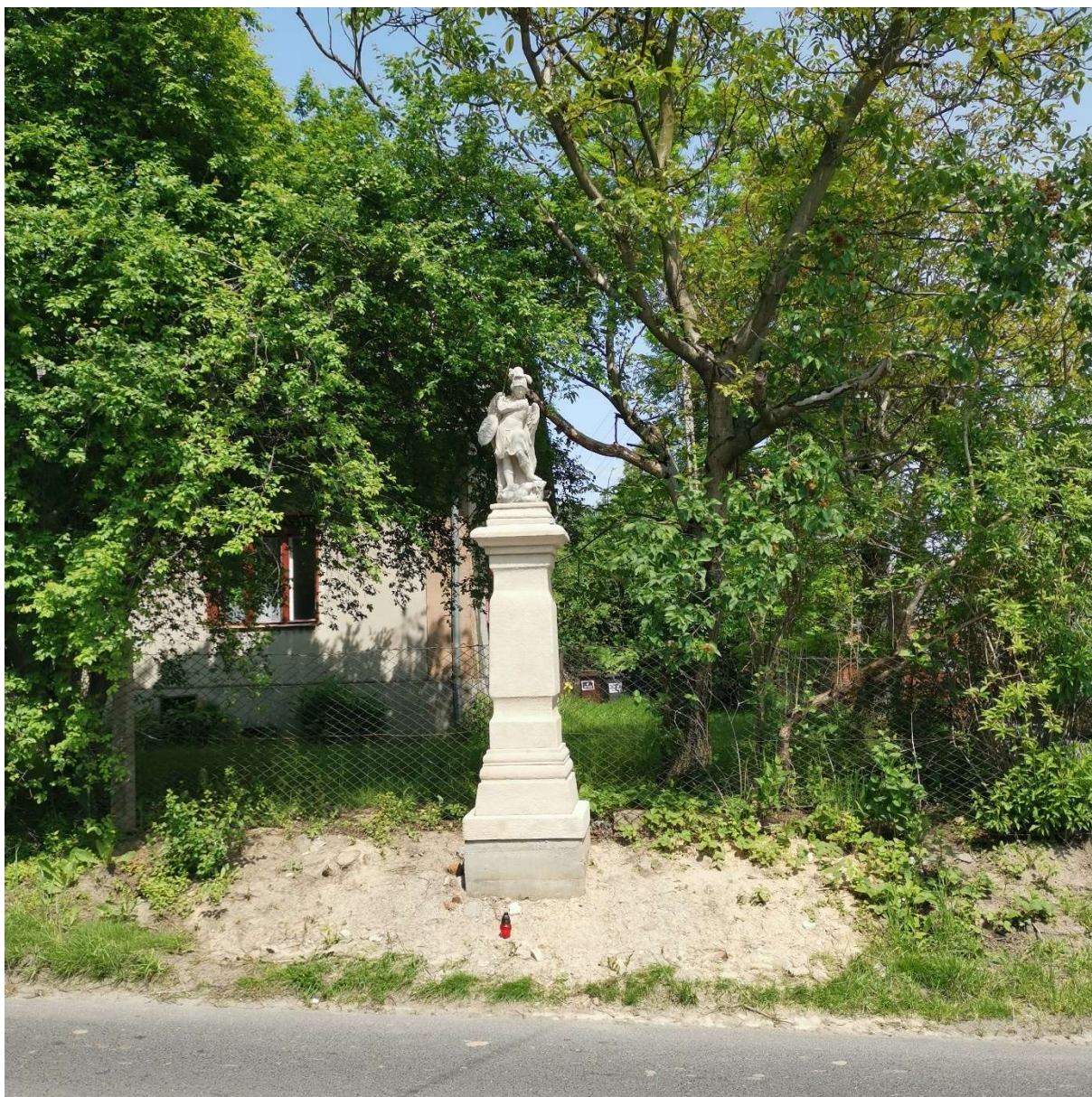
Figura św. Michała Archanioła w Bestwinie stan na maj 2023r. (po zakończeniu prac)