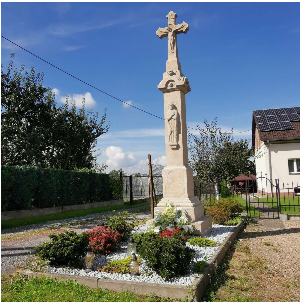
Krzyż kamienny połowa XIX w. przy ul. Witosza 173 w Bestwinie