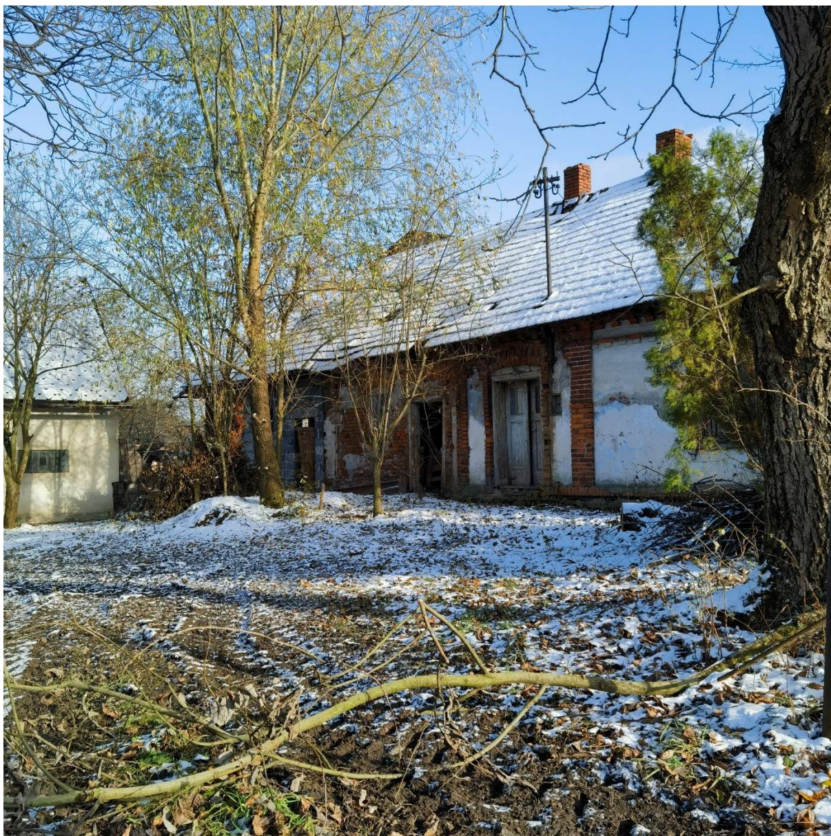
Budynek mieszkalno-gospodarczy ul. Janowicka 151 Janowice