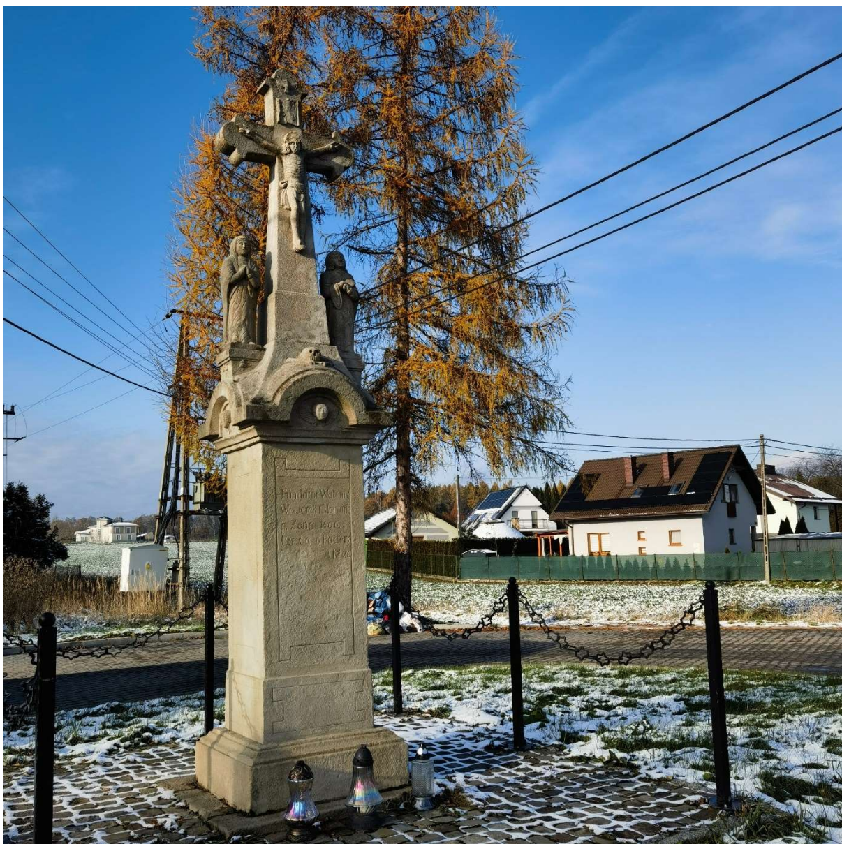
Krzyż Kamienny Przydrożny Nikłówka druga poł. XIX w. po usunięciu śladów dewastacji w 2020r.