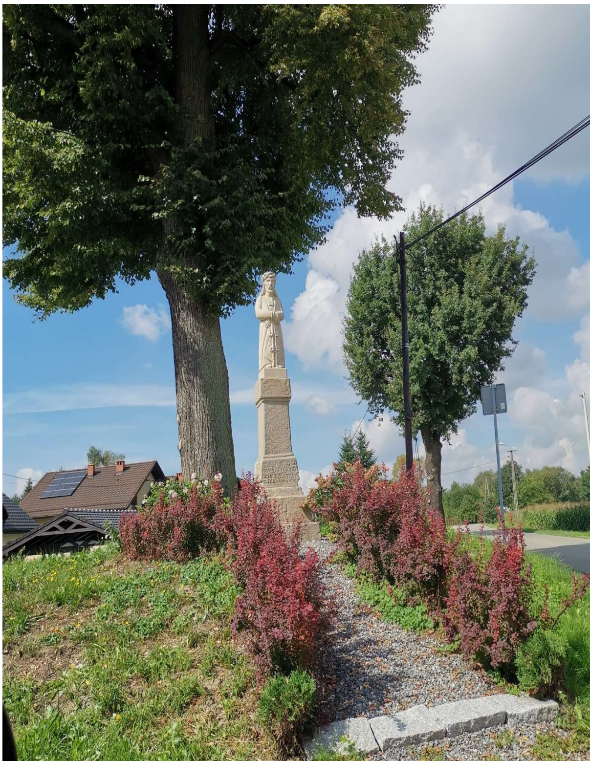
„Figura Chrystusa na postumencie” z 1814 r. Figura stoi u zbiegu ulic Stefana Kóski i Walentego Furczyka w Kaniowie, po renowacji.