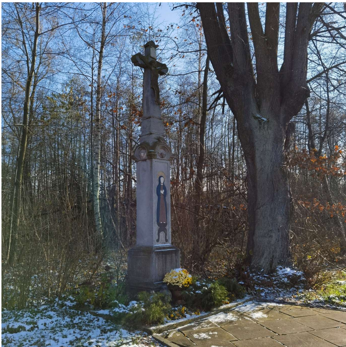
Krzyż kamienny przydrożny z płaskorzeźbą Matki Boskiej Bolesnej, skrzyżowanie ulic W.Witosa/Podpolec 1 w Kaniowie

W zakresie pozytywnych aspektów wskazać należy na następujące okoliczności i sposób wykonania dotychczasowych założeń programowych. W ramach programu opieki nad zabytkami realizowano następujące zadania.