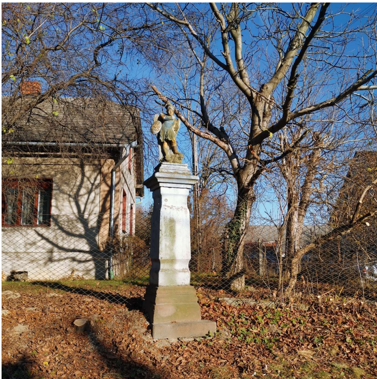
Figura św. Michała Archanioła w Bestwinie koniec XVIII w. stan na listopad 2022r. (przed rozpoczęciem prac renowacyjnych)