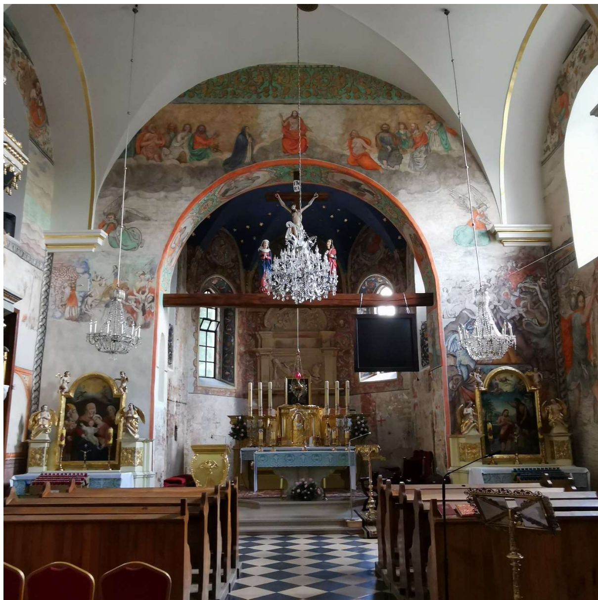
Kościół PW Wniebowzięcia Najświętszej Maryi Panny w Bestwinie

okiennej, wymianie rynien, naprawie kominów, wymianie drzwi wejściowych oraz na przebudowie wejścia i wyjścia na tereny wokół obiektu. Całkowity koszt inwestycji to 144 200 zł., poziom dofinansowania – 40%, beneficjentem jest Gminny Ośrodek Kultury w Bestwinie.