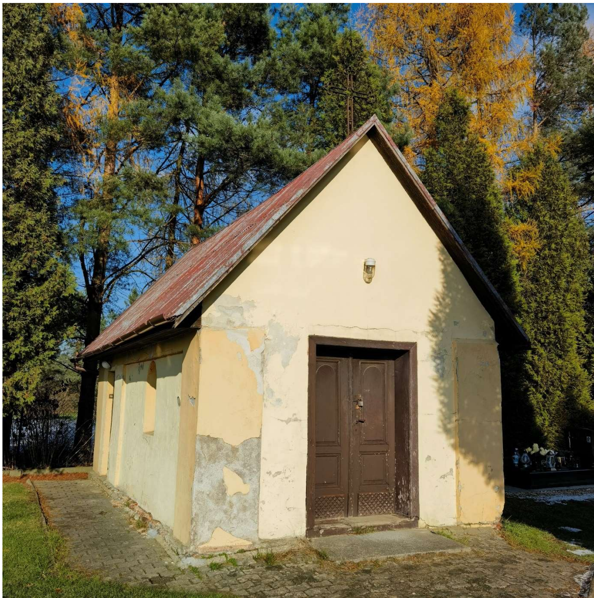
Kaplica cmentarna na cmentarzu w Kaniowie